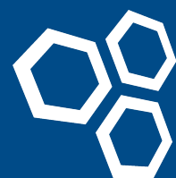
Imagem e Reputação

A não observância de qualquer conduta prevista neste Código pode levar à perda da reputação da CRP Tecnologia ou da CRP Computadores e a ter sua imagem denegrida, por isso, todos os colaboradores, parceiros e terceiros são responsáveis por zelar pela imagem e reputação. É responsabilidade de todos conhecer e aplicar as diretrizes do Código de Conduta Ética, bem como demais documentos normativos internos ou da profissão a fim de garantir um ambiente e relações pautadas em elevados padrões de conduta ética e nos valores da empresa.